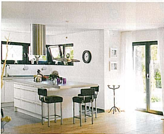
Der Wohn-, Ess- und Kochbereich ist komplett transparent gestaltet.