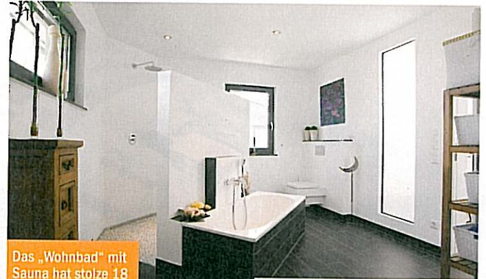
Das „Wohnbad“ mit Sauna hat stolze 18 Quadratmeter.

Im Obergeschoss leben die Bewohner in großzügig geschnittenen, hellen Räumen ohne Dachschrä-